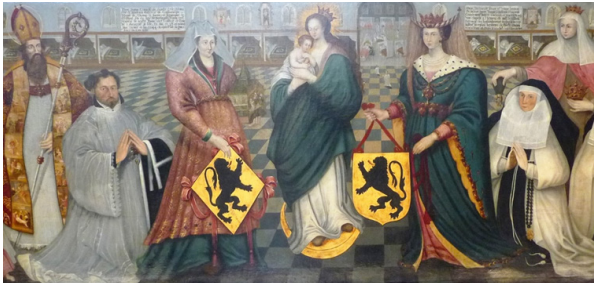
Afbeelding: Joanna en Margareta van Constantinopel dragen het hospitaal van Rijsel op onder de bescherming van O.-L.-Vrouw. (Musée de l'Hospice Comtesse Lille, Olieverf op doek, Anonim, 1632)