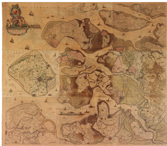
Foto: monumentale samengestelde wandkaart van Zeeland door Ottens (1725) – recente aanwinst via Van De Wiele Auctions voor de collectie SteM Sint-Niklaas