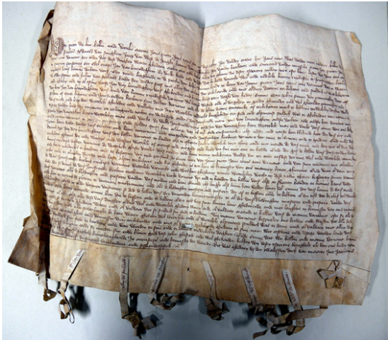
Voorbeeld van één van de mooie akten in de bundel